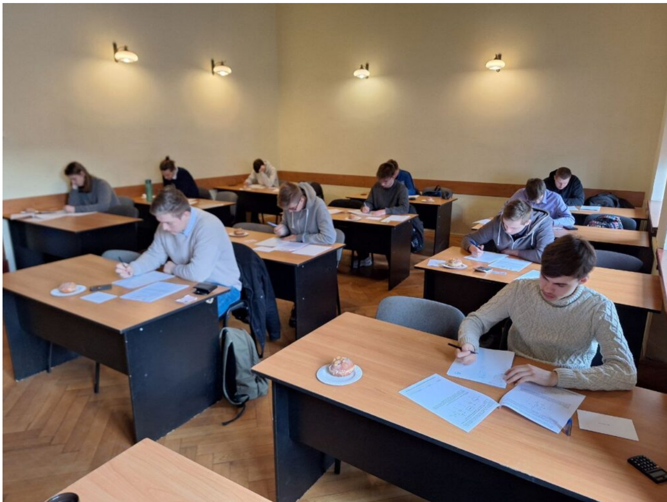
Fot. Uczestnicy Olimpiady Elektromechatron ed. 2024